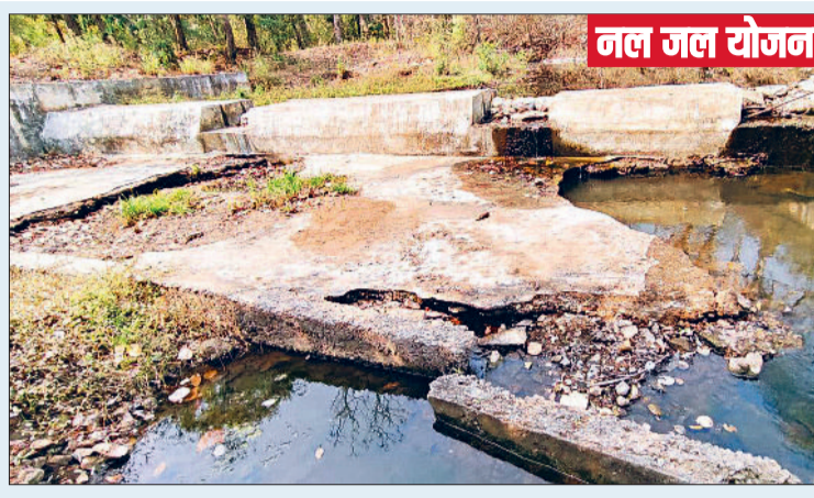
नल जल योजना के नाम पर लाखों खर्च, फिर भी गांव प्यासा

उन्होंने कवर्धा विधानसभा में विकास एवं निर्माण कार्यों के नाम पर किए जा रहे बड़े भ्रष्टाचार की पोल खोलते हुए बताया कि प्रदेश सरकार ने करीब सालभर पूर्व जिले के भोरमदेव अभ्यारण के कोकदा क्षेत्र में करीब 30 से 35 लाख रूपए प्रति नग की लागत से दो चेक डेम की स्वीकृति प्रदान की थी। मंशा थी कि अभ्यारण क्षेत्र में व्यर्थ से बहने वाले जल को चेकडेम में