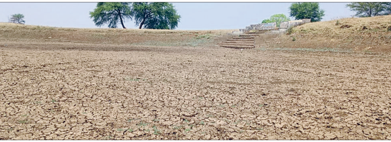
हरिभूमि न्यूज ► सड़क अतरिया

गर्मी की दस्तक के साथ गांवों में पेय एवं निस्तारी जल की समस्या गहराने लगी है। तालाब और कुएं सूख गए हैं। हैंडपंप दम तोड़ने लगे हैं। बोर से मटमैला पानी आने लगा है। गर्मी के शुरूआत जो स्थिति दिखाई दे रही है उसे देखते हुए तय है कि आने वाले दिनों यह समस्या गंभीर रूप ले सकती है। संकट गहराने के बाद भी लोग जल संरक्षण को लेकर गंभीरता नहीं दिखा रहे हैं। सार्वजनिक नलों से हजारों लीटर पानी व्यर्थ बहते रहता है। वहीं किसान तीसरी फसल लेने की तैयारी में हैं। क्षेत्र के लगभग सभी गांव नल जल योजना पर आश्रित है जिससे एक पहर भी पानी नहीं आने से हाथ-तोबा मच जाती है।